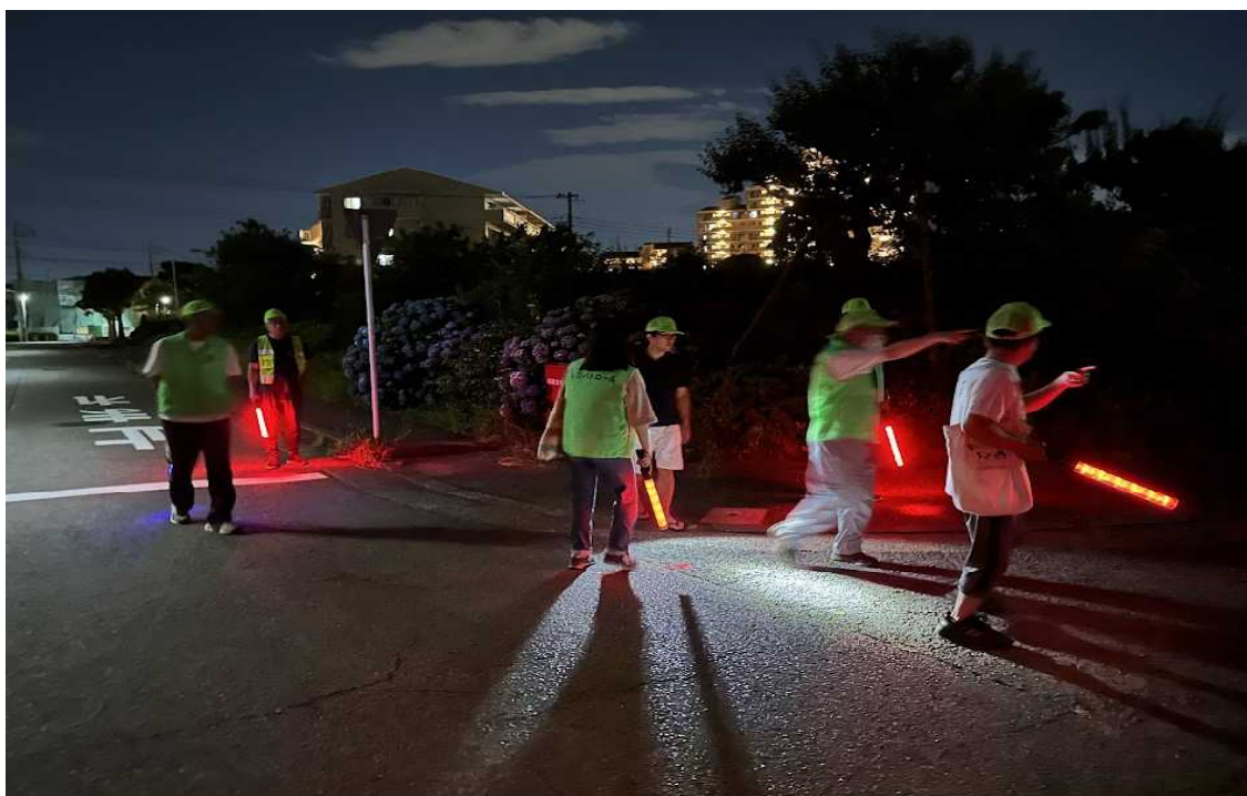
《巡回区域を協力し合って見回る防犯パトロール隊》